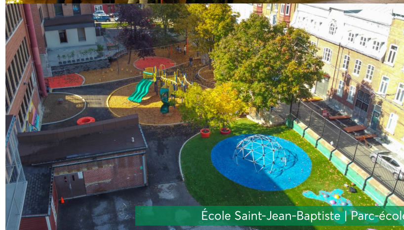
École Saint-Jean-Baptiste | Parc-école