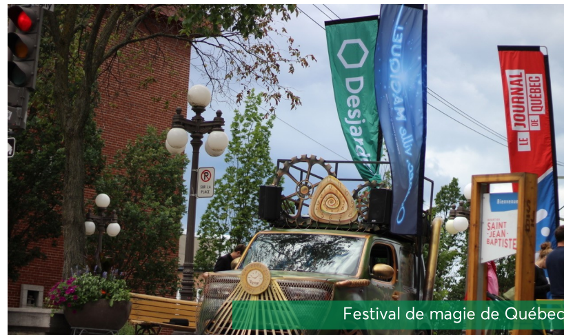
Festival de magie de Québec