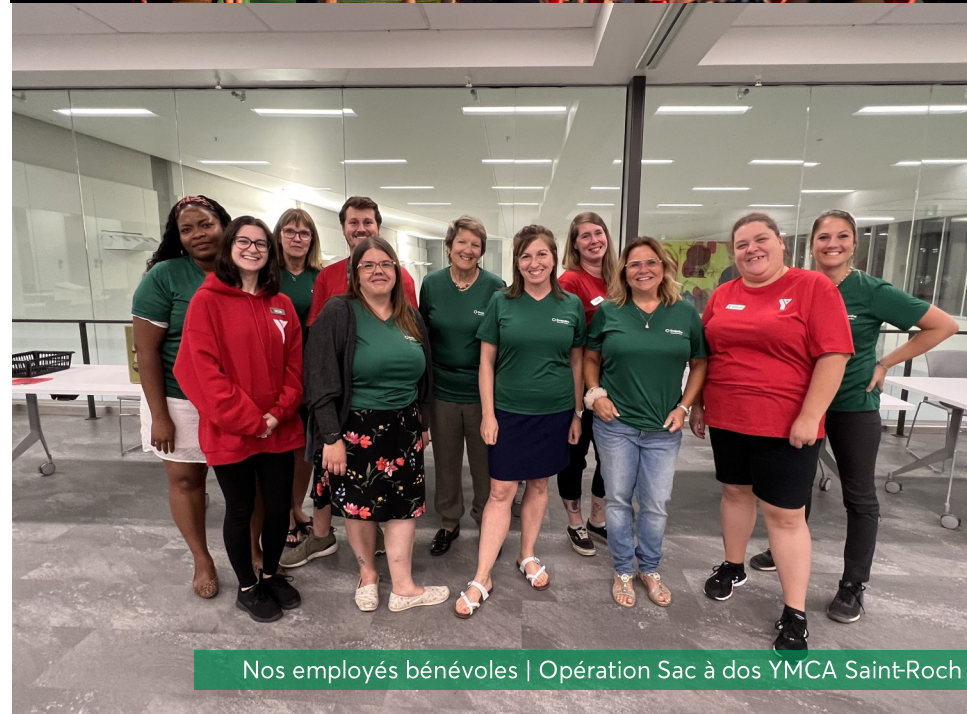
Nos employés bénévoles | Opération Sac à dos YMCA Saint-Roch