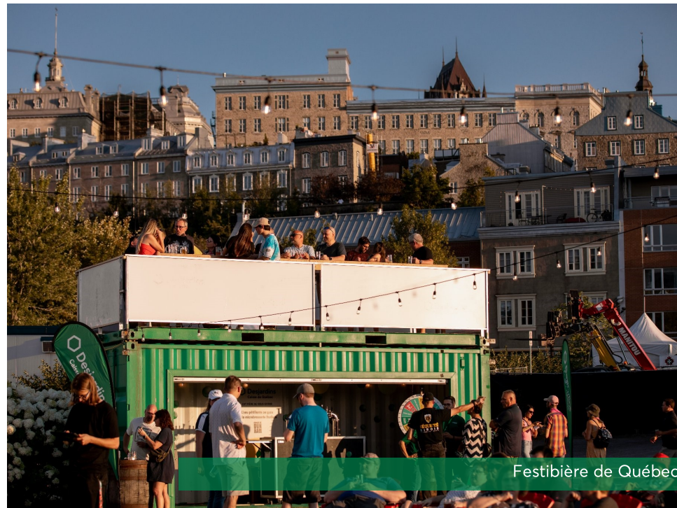
Festibière de Québec

La Caisse peut offrir du temps et son expertise grâce à l'implication humaine du personnel et des administrateurs. Nous proposons d'ailleurs le programme « 2 heures pour ma caisse » qui encourage nos employés et nos administrateurs à s'impliquer bénévolement auprès de nos organismes partenaires.