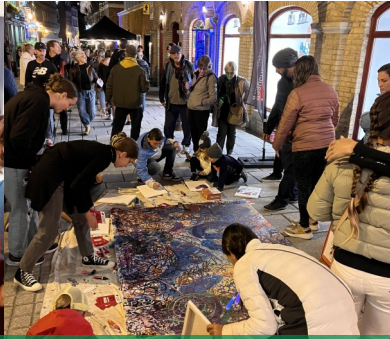
La Nuit des Galeries