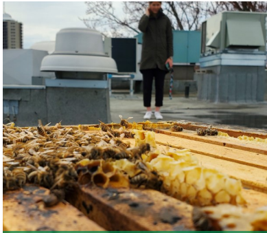
Alvéole : ruche sur le toit