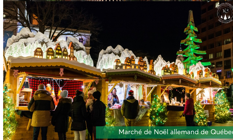
Marché de Noël allemand de Québec